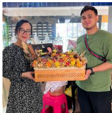
Gubahan VIP Buah Kering