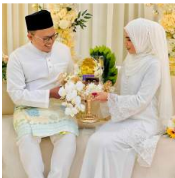
Gubahan Hantaran Kahwin