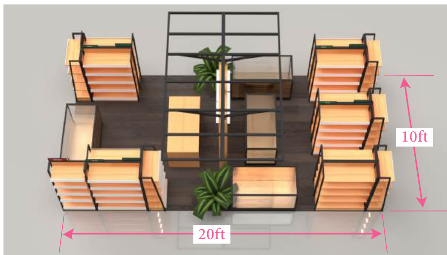
Lakaran Illustrasi 3D Kiosk Baru (Pandangan dari Atas, Keluasan 10ft x 20ft)

Kami bercadang untuk mewujudkan kiosk 10ft x 20ft bagi memberi lebih ruang kepada paparan produk serta pengalaman pelanggan yang lebih selesa. Separuh daripada kiosk ini akan diperuntukkan kepada produk IKS (Industri Kecil & Sederhana) yang viral dan popular, sebagai langkah mempelbagaikan tawaran serta menyokong usahawan tempatan lain.