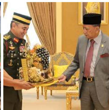
Gubahan VVIP Buah Kering dipersembahkan kepada Sultan Kedah